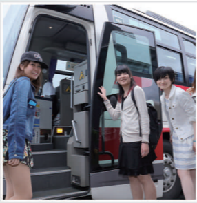
JR札幌駅から高速バスで約2時間。お得なセットプランもあります！