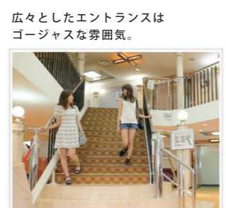
広々としたエントランスはゴージャスな雰囲気。