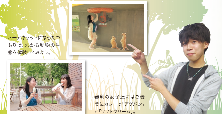
ミーアキャットになったつもりで、穴から動物の生態を体験してみよう。