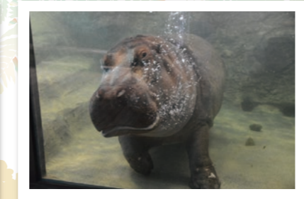
「カバ・ライオン館」では、こんな生き生きした普段の動物を見ることが。