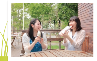
審判の女子達にはご褒美にカフェで「アゲパン」と「ソフトクリーム」。