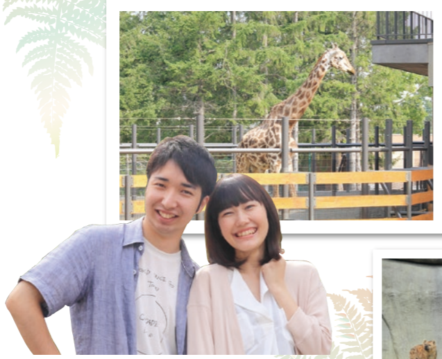
アフリカゾーンの目玉施設のひとつ「キリン館」。プチハイエナもこんなに近くで見れちゃいます。

地下鉄「円山公園」駅から徒歩15分と身近なスポット、さっぽろ円山動物園にアフリカゾーンが待望の全面オープン!今回は、草食系のガクワリ男子スタッフがアフリカゾーンを体験して「野生化」できるか実験。その結果を女子スタッフが検証します。