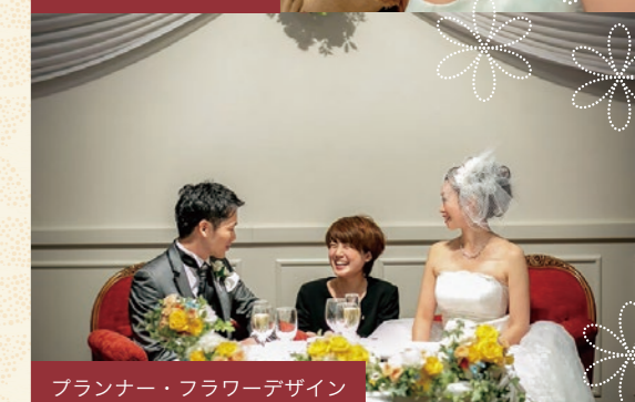
プランナー・フラワーデザイン

ウエディングやイベント・パーティのプランをしたり、接客でコミュニケーション能力を養ったり。アルバイトで報酬を得ながら、自分のスキルアップを図れます。