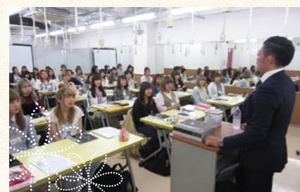
プロジェクトのガイダンス時からやる気で真剣な学生達。

現場体験やアルバイトで認められた人材は、創和プロジェクトに就職する近道。その他提携しているホテルや結婚式場、ヘアメイクスタジオなどのご紹介も可能です。