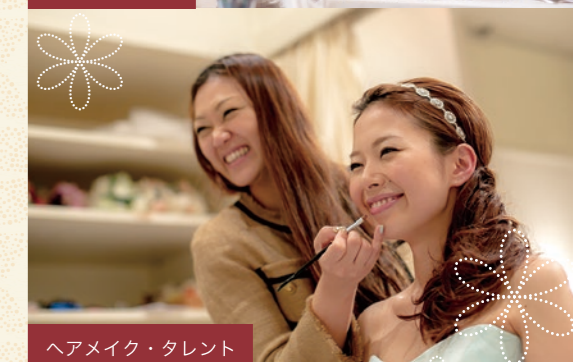
ヘアメイク・タレント

ブライダルやヘアメイク、フラワーデザイン、飲食、そして音響や照明、パフォーマンスなど。自分が目指す専門分野の仕事や職業を在学中に第一線の現場で体験できます。