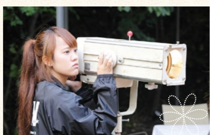
照明や音響のプロを目指す学生もステージ演出で活躍。