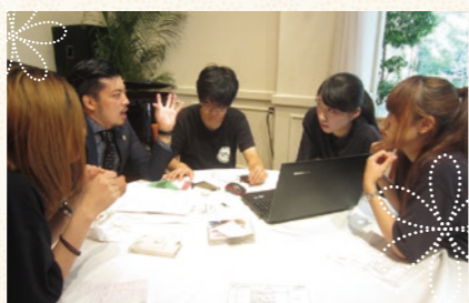
イベントの成功に向けて何度も事前ミーティングを実施。