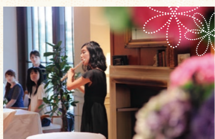
ゲストのウェイトングルームでは教育大の学生がフルートを演奏。