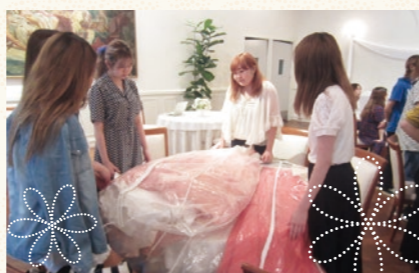
イベント前日は会場で、ドレスや演出を入念にチェック。