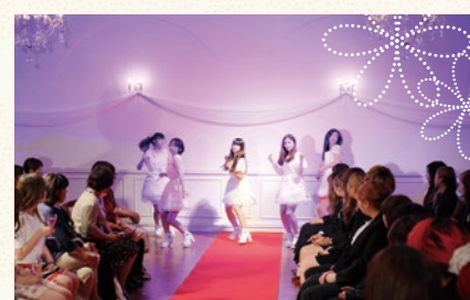
自分達が企画した様々なプランが実際にカタチになりワクワク。