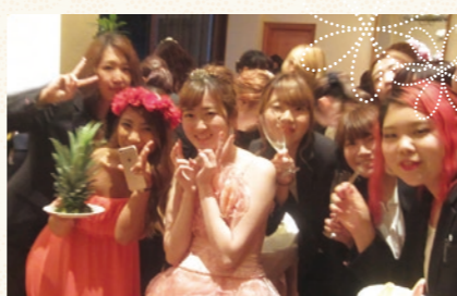
自分を出し切った学生達はイベントが終わって歓喜。

GAKUWARI × SOWAWEDDINGS 現場体験&バイト キャリア支援プロジェクト 参加者エントリー受付中!