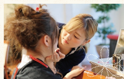
当日はヘアメイクのプロを目指す学生達も活躍。