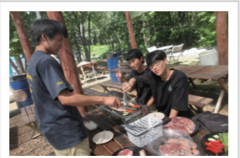
手びらでパーベキョー