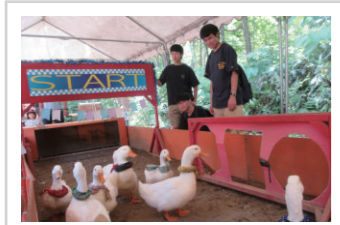
イベントアトラクション